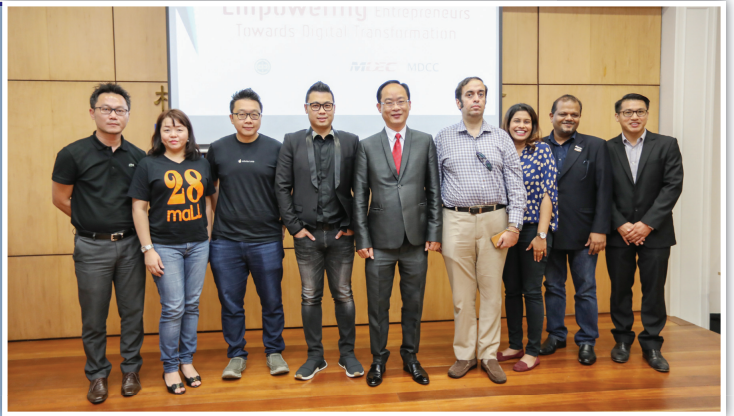
大会在赠送纪念品予主讲者后, 合影留念。

他指出, 我国首个数码自由贸易区(DFTZ)将于今年10月初开始运作, 而大马数码经济机构(MDEC)将会选出1500间中小型企业参与线上跨境贸易。