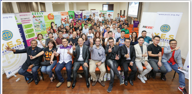
大家在活动结束后, 来张大合照留念。