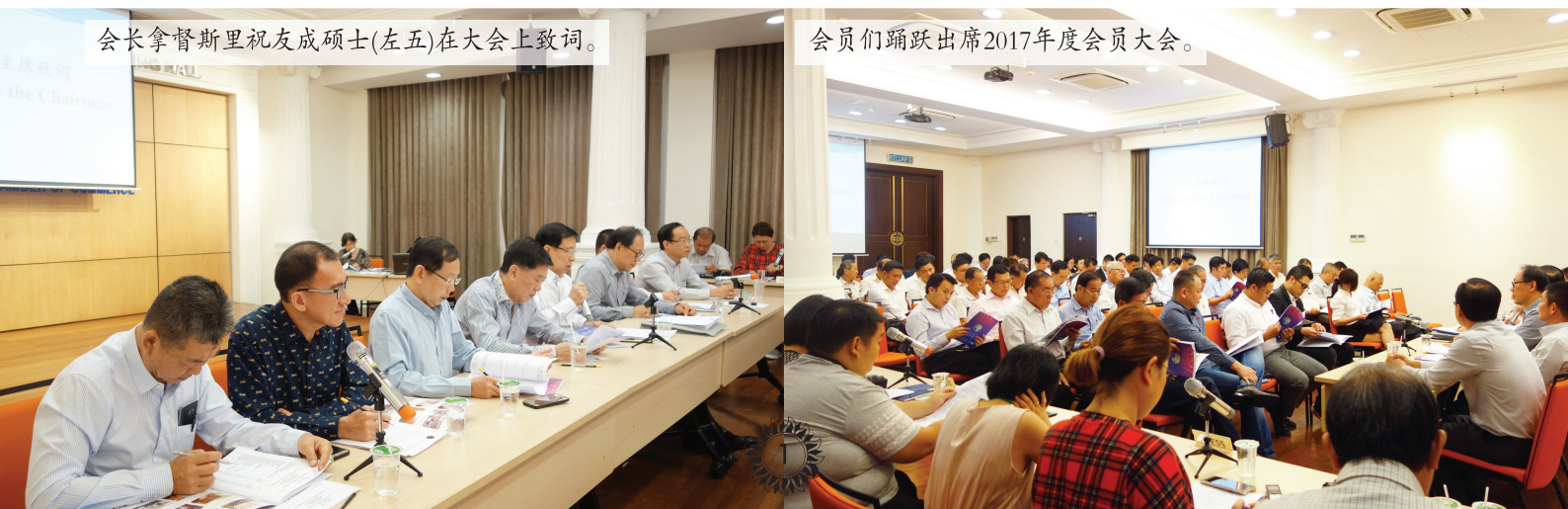
会员们踊跃出席2017年度会员大会。